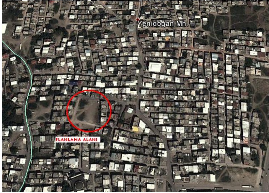
Planlama alanı

Alan ilçe merkezinin güneyinde Yenidoğan mahallesi sınırları içerisinde yer almaktadır. İlçe merkezine uzaklığı 1700 m, Ankara Yoluna uzaklığı 750 m'dir.